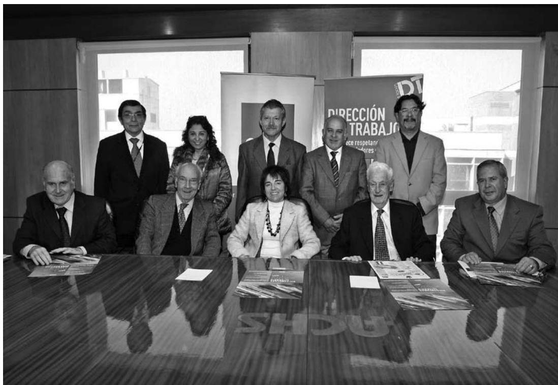
Durante el lanzamiento, la Directora del Trabajo, representantes de los auspiciadores y miembros del jurado 2009.