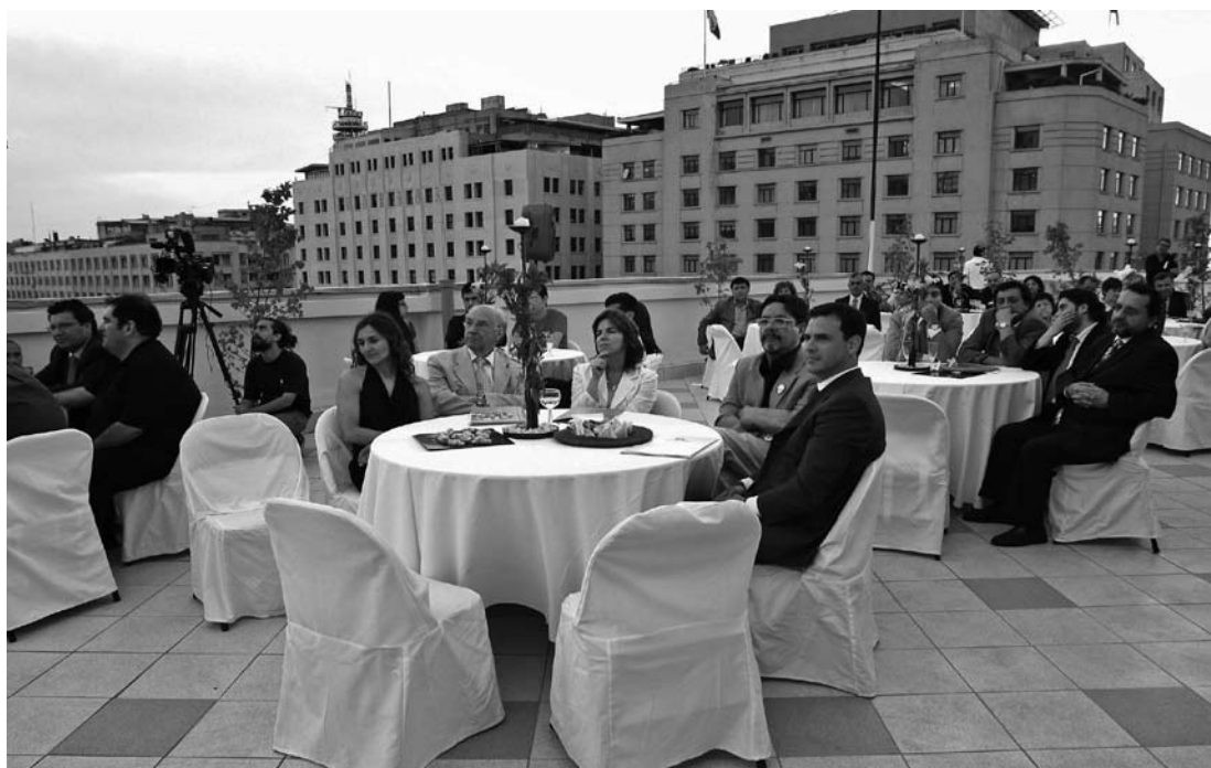
Un aspecto de la premiación 2008, realizada en la terraza de la Dirección Nacional del Trabajo.