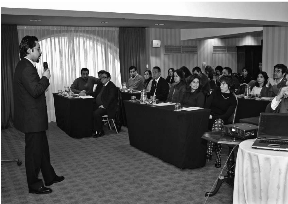
Un aspecto de la instrucción que recibe personal de la Dirección del Trabajo.